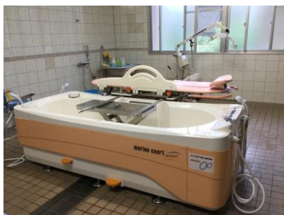
浴室に設置した特殊浴槽一式