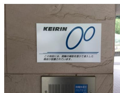
施設正面入口の補助標識